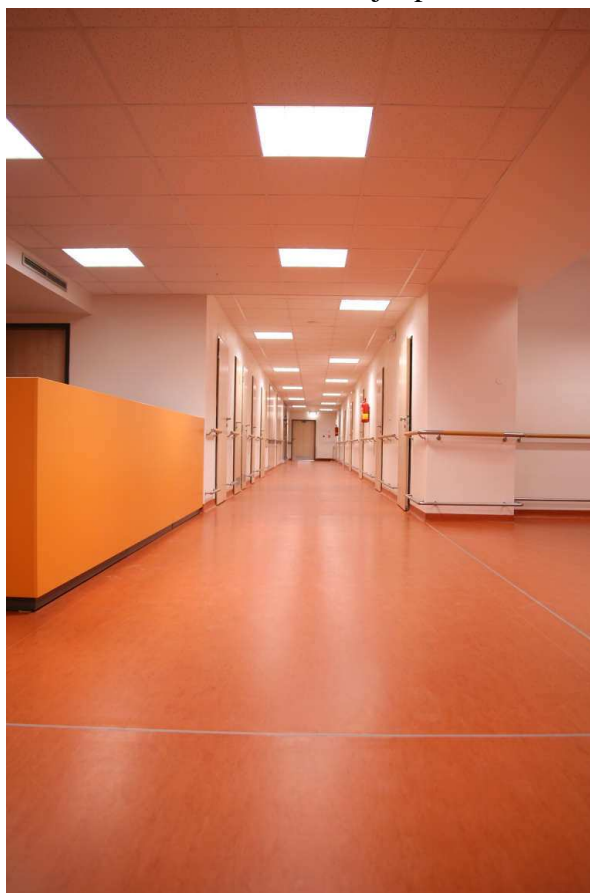
Oddělení léčebné rehabilitace a fyzioterapie

Stavba bloku rehabilitace byla zahájena v dubnu 2008 a ukončena v prosinci 2008. V lednu byl zahájen zkušební provoz. Celkový objem investice dosáhl 24 mil. Kč